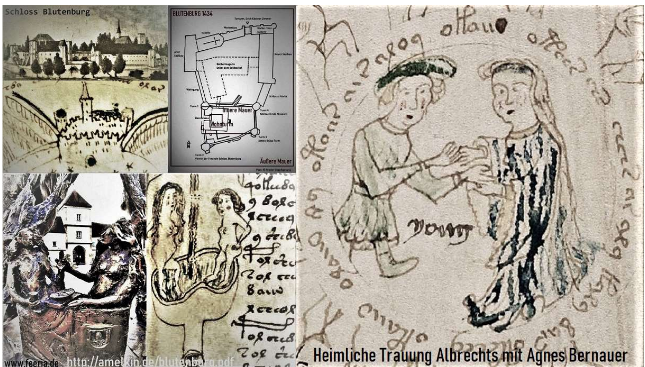
Das Voynich-Manuskript von Johannes Hartlieb: Schloss Blumenburg mit Wohnturm (1424-1425), Balneotherapie (warmes Bad), die heimliche Trauung Albrechts mit Agnes Bernauer (1423), verschlüsselte Zaubersprüche (z.B. Hexensalbenrezept " unguentum pharelis ": Eisenkraut, Mondraute, Einjähriges Bingelkraut, Donnerbart, Alraune, Frauenhaarfarn, Johanniskraut, Vogelblut, Tierschmalz und Zauberspruch " Sholdy doldy doldaiin dar dar dal ol ydaiin " - es kommt nicht auf die Aussprache, sondern auf die Lautfolge an)

The consciousness of a person (for example, a guest or a resident of the Blumenburg Castle) with its subsystems is a subsystem of the consciousness of the Blumenburg Castle, which is a subsystem of the Consciousness of the Universe with the creative possibility of exchanging information between all subsystems, including subsystems remained from the past. If a person masters the technologies of green fog (smog) and the systematic approach subalgorithm SOSSS ( stop - observe - smog - solution - step ), then it will be able to connect to any subsystem of consciousness and self-consciousness (for example, the Blumenburg Castle) and to solve any problems. The formation of special cultural and creative skills allows a person unlimitedly to develop its extrasomatic pampsy-structure of consciousness and self-consciousness connected with the Consciousness and the Long-term Memory of the Universe.